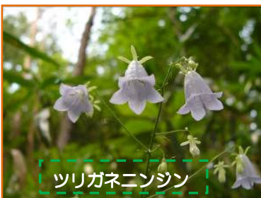
ツリガネニンジン