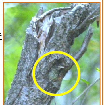
キビタキのヒナが巣から出る直前の姿

今年観察できたキビタキのヒナは、巣から出て約2週間でみずからエサをとる姿を確認できました。これからヒナたちが、冬を元気にのりこえ、立派に育ってくれるでしょう。