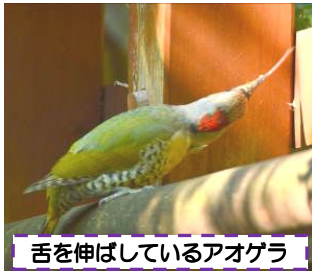
舌を伸ばしているアオゲラ