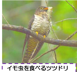
イモ虫を食べるツツドリ