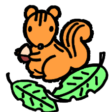
左：マツボックリ 右：リスが食べたあと