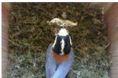
巣箱で巣作りにはげむヤマガラ (3/6撮影)

今年は何羽の鳥たちが巣立つのか楽しみにしながら、こうした子育ての工夫も観察してみたいかがでしょうか。(小鳥の森スタッフ：きぐち ちか)