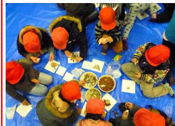
野鳥の巣箱づくり体験