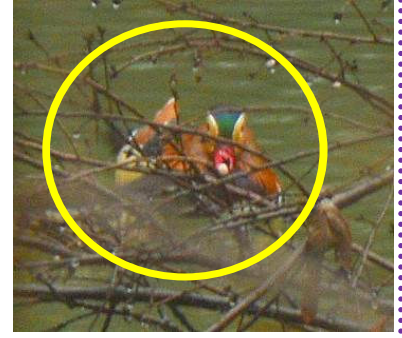
枝越しにオシドリが池にいるのが見えました。

近年では、2013年4月13日にもオシドリのペアが来たことがありました。もしかすると、子育ての場所として園内の池を考えていたのかもしれませんが。