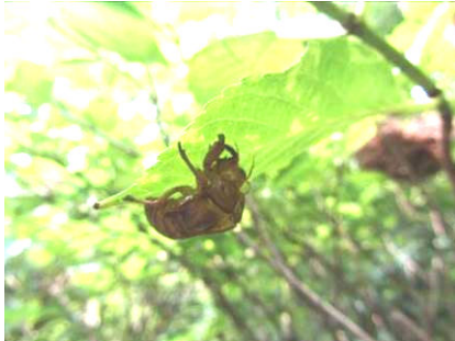
セミの幼虫の抜け殻

また夕方には、ヒグラシがカナカナカナと鳴いて一日中セミの声でにぎわった夏でした。