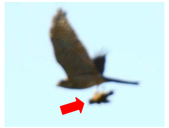
足に小鳥を持っていました