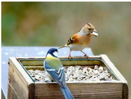
アトリ(右)とシジュウカラ(左)

今年は雪の少ない新年を迎えました。 気温も例年より高かったため、園内の日当たり の良い場所ではヤマツツジの花が咲いていまし た。