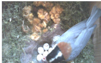
昨年の子育ての様子