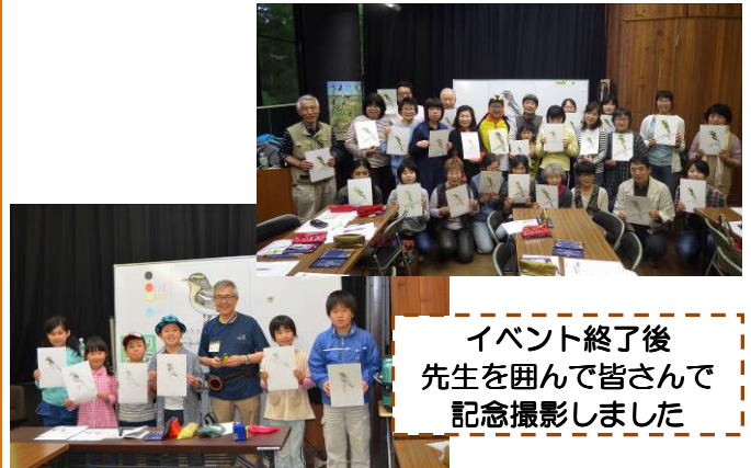
イベント終了後 先生を囲んで皆さんで 記念撮影しました

午前中は小学生、午後は大人の方を対象に2回実施しました。とても丁寧に、時には野鳥とのエピソード等を交えながら、タマゴを使った野鳥の書き方を教えていただきました。皆さんとても上手にキビタキを描いていました。