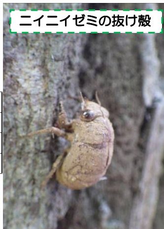
ニイニゼミの抜け殻

園内は昆虫採集禁止なのですが、捕まえずにじっくりと観察することで、気づくこともたくさんあります。ぜひ虫を探しに小鳥の森へお越しください。