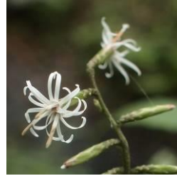
オクモミジハグマ

これからの季節、ますます花盛りになるキクの仲間を観察しながら、昔の風習に思いをめぐらすと、いつもとは違う秋を過ごせるかもしれません。