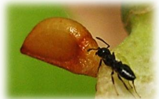
カタクリのタネを運ぶアリ