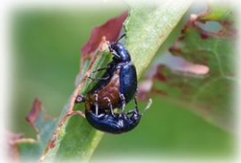
コガタルリハムシ

春になってから出てくる生き物はたくさんいます。そのような生き物を「春告〇〇」と言ったりします。私たちの身の回りで有名なものは春告鳥のウグイスです。昆虫の中でも春になると真っ先に目につくものが何種あります。その中でも普通に見られて綺麗だと思うのが、コガタルリハムシです。ギシギシやスイバを食草とするハムシの仲間です。皆さんも季節の変わり目に出てくる生き物に注目してみてください。