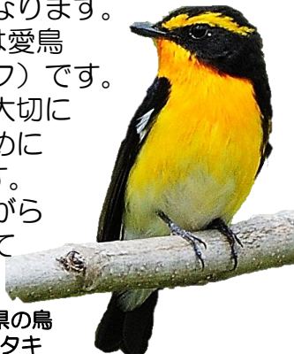
福島県の鳥 キビタキ

5月10日～16日は愛鳥週間（バードウィーク）です。野鳥を通じて自然を大切にすることをはぐくむために設けられた1週間です。野鳥観察を楽しみながら自然の良さを実感してみませんか。