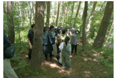
夏鳥ウォッチングのようす

寒い日が続いたあとでの探鳥会であったため、野鳥の姿やさえずりが確認できるかわからず、不安な出だしではありましたが、多くの野鳥を観察できた探鳥会となりました。