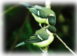
シジュウカラ巣立ちヒナ

また、巣立ちヒナが地面などにいる場合があります。その場合、親がそばにいてヒナはエサを待っています。ヒナの今後の成長のためにもそっと見守ってヒナを捨てることのないように注意して下さい。