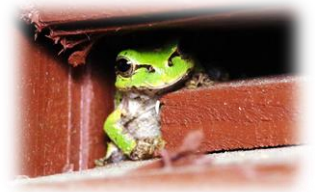
ニホンアマガエル

雨の日でも外を歩いてみると、いろいろな生き物の隠れている様子を見ることができました。