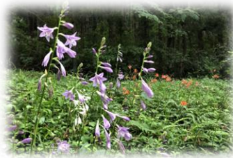
コバギボウシ（手前）とキツネノカミソリ（おく）

猛暑日を超える気温の中でも暑さに負けじと元気に花を咲かせている様子に私たちも元気を分けてもらえた気がします。