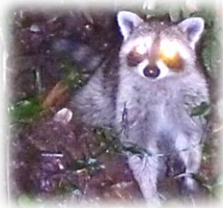
小鳥の森で確認されたアライグマ