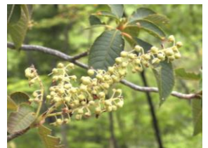
リョウブ (実・未熟)