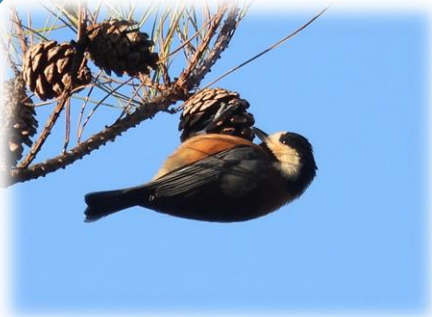
マツボックリとヤマガラ